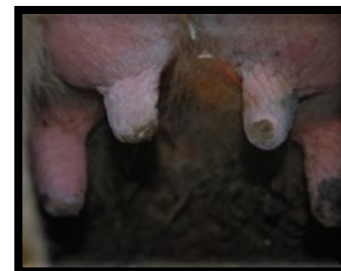
Example of teats with frost bite.