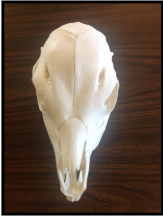
1 – 3 días de edad

El brote de cuerno se une al hueso entre los 30 a 60 días, por lo tanto, descornar es menos invasivo y puede causar menos dolor. Actualmente se recomienda utilizar manejo para el dolor (lidocaína y un anti-inflamatorio