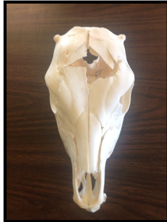
2 – 4 meses de edad

no esterooidal como el meloxicam) siempre que los becerros sean descornados usando una plancha caliente. Sin embargo, si se utiliza pasta cáustica, la lidocaína no debe utilizarse y la pasta se debe aplicar en los primeros tres días de vida.