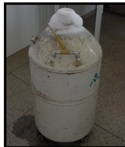
An accumulation of frost at the top of your semen tank indicates a loss of vacuum in the tank, and damaged semen.